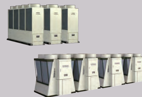
スクロール・スクリーチャーユニット