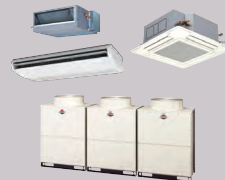
ビル用マルチエアコン